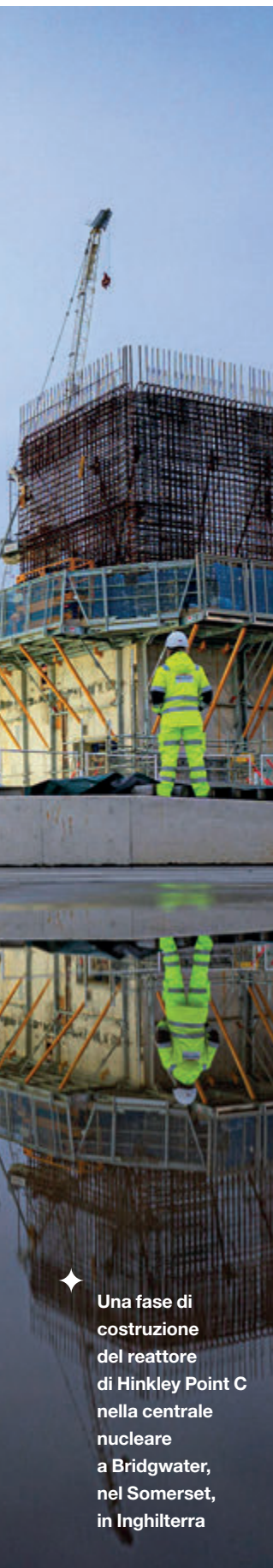
Una fase di costruzione del reattore di Hinkley Point C nella centrale nucleare a Bridgwater, nel Somerset, in Inghilterra

La proposta concreta della statunitense NuScale Power pare avere avuto fortuna. L'azienda statunitense avrebbe dovuto costruire una centrale con sei SMR da 77 MWe ognuno, per un totale di 720 MWe, entro il 2029 presso l'Idaho National Laboratory del Department of Energy (DOE). Progetto che è stato annullato per l'impennata dei costi che sono passati da 3,6 miliardi di dollari per 720 MWe a 9,3 miliardi per soli 426 MWe residui, con 4,2 mld$ che sarebbero stati coperti dal DOE e dall'Inflation Reduction Act (IRA), lasciando 5,1 mld$ ai privati. Il tutto con un prezzo dell'energia di 89 $/MWh, cifra già ridotta dall'IRA, senza il quale il costo sarebbe stato di 119 $/MWh. La cancellazione del progetto è costata, inoltre, il posto di lavoro a 154 persone. Il 28% dei dipendenti di NuScale Power e il titolo dell'azienda è crollato del 30%. Un duro colpo per l'unica azienda che ha ottenuto, a oggi, l'approvazione negli Stati Uniti per un SMR. E i costi con ogni probabilità sono dietro al disinteresse verso gli SMR da parte della nazione più "atomica" di tutto il Pianeta: la Francia. «Ciò dimostra